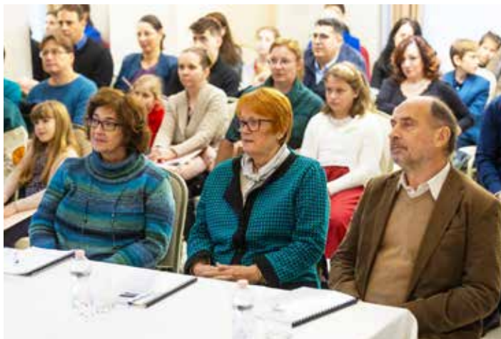
A zsűri tagjai