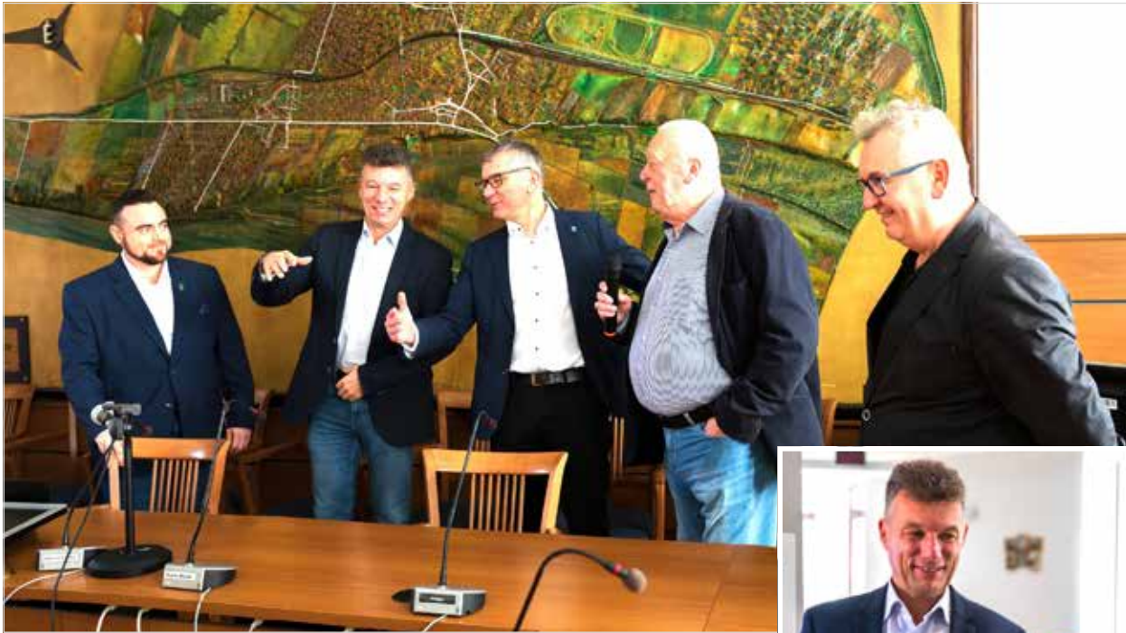
Tartalmas és jó hangulatú volt a találkozó