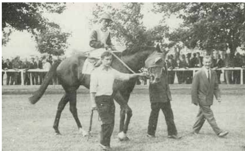
Nemo kapitány nyergében (1969)

Imperiál 1960. február 14-én született, a kisbéri ménésben. Apja, Imi kiváló magyar versenyló volt, így az újszülöttől is sokat vártak a zöld gyepen. És Imperiál eleget tett az elvárásoknak: a legendás alagi tréner, Aperiaonov Zakariás keze alatt a 20. század egyik, ha nem a legjobb magyar versenylovává vált. Persze, kellett a kiváló ló és a még kiválóbb tréner, de nem feledkezhetünk meg a zsokékról sem, akik a versenyeken győzelemre vitték e csodás lovat.