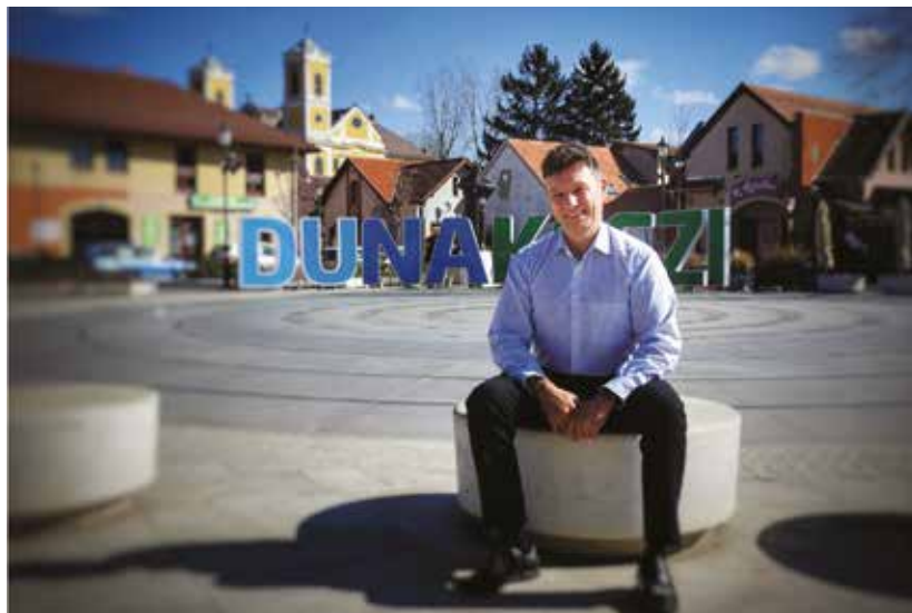
Dióssi Csaba polgármester

- Férjemmel és két lányommal 2013 óta élek Dunakeszin. Szekszárdi születésű, vidéki lány vagyok. A nagyobbik lányom 19 éves, kéttannyelvű közgazdasági technikumba jár. A kisebbik lányom harmadik osztályos. Fontos számomra a sváb származá-