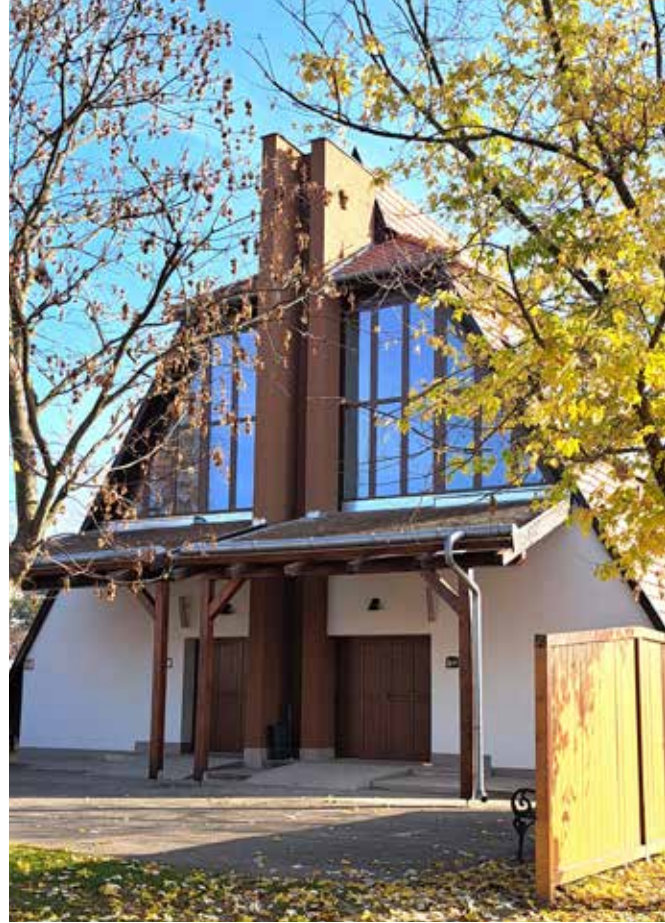
Megújultak a temetői épületek is