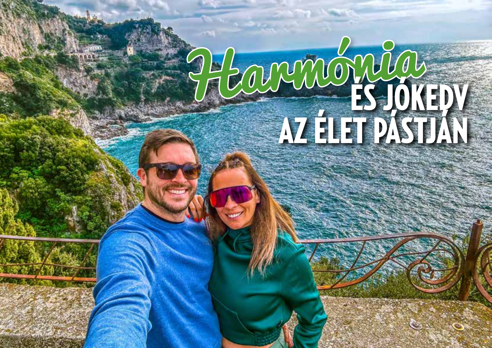
A Somfai házaspár