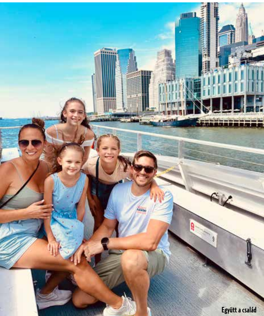
Együtt a család