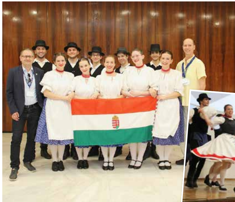
Akik Athénban is öregbítették Dunakeszi jó hírét

Októberben a VOKE József Attila Művelődési Központ meghívást kapott a Vasutas Kulturális Egyesületek Nemzetközi Szövetségének a Folklór Fesztiváljára, Athénba. Az intézmény korábban már két alkalommal vett részt a fesztiválon és csakúgy, mint 2014-ben Selmecbányán (Szlovákia) és 2018-ban Welsben (Ausztria), idén is a Dunakeszi Duna Gyöngye Néptáncgyüttessel vettünk rajta részt.