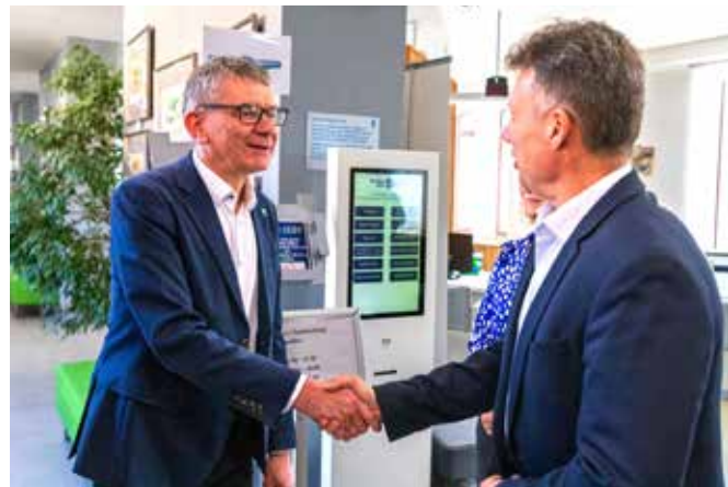
A két újválasztott polgármester örömteli találkozója