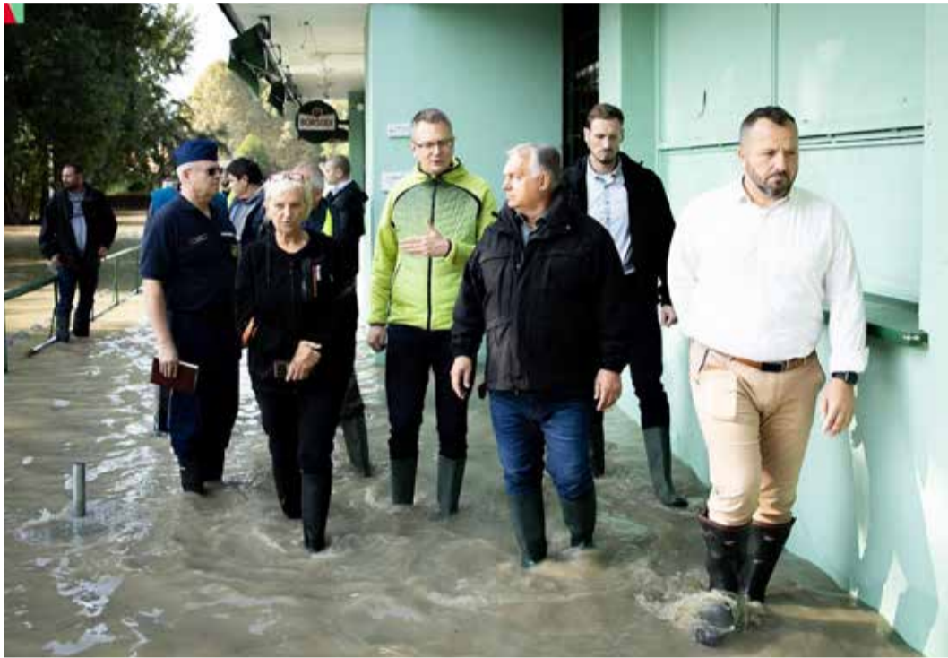
Nagymaros: Orbán Viktor miniszterelnök ellenőrizte a dunakanyari árvízi védekezést