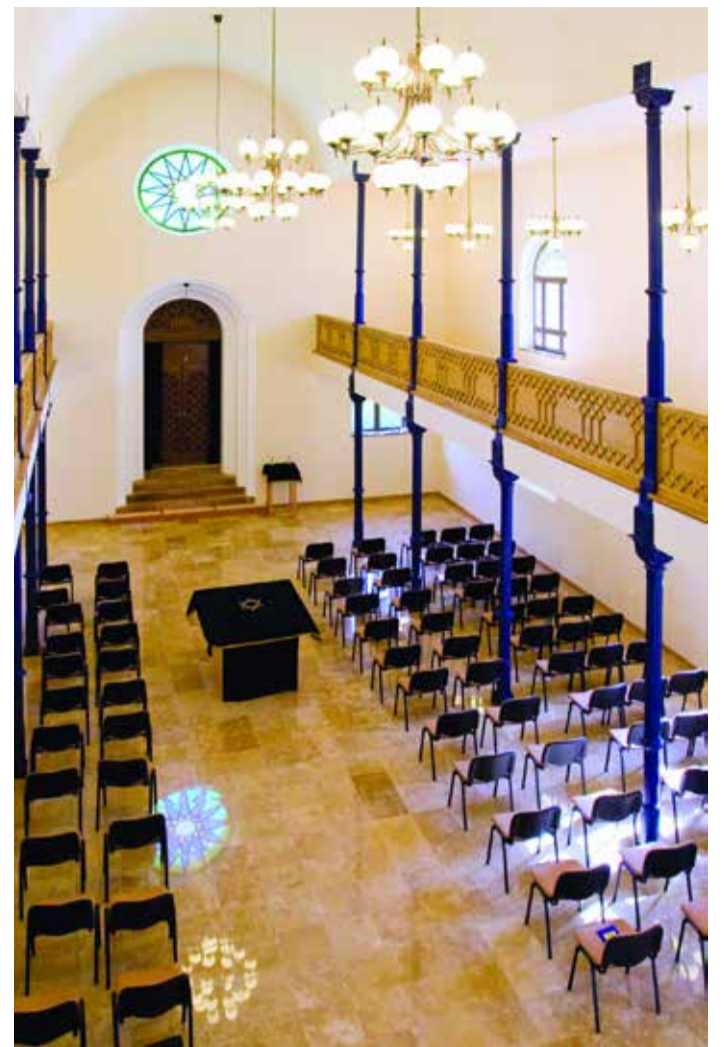
A 160 éves zsinagóga épületének belső terei is megújultak

Az épület országosan védett műemlék, ami szerencsére Pest vármegyéhez tartozik, ahonnan minden építészeti engedélyt, tanácsot soron kívül megkap a hitközség. A Magyarországi Zsidó Hitközségek Szövetségétől ebben az évben kapott felújítási alaphoz megkezdődhetett az épület falazatának a feljövő víztől, sőtől és salétromtól való végleges szigetelése, amit sajnos forráshiány miatt abba kellett hagyni. Ezért a hitközség kéri Magyarország kormányát és Pest vármegye vezetését, hogy továbbra is segítsék az építési mun-