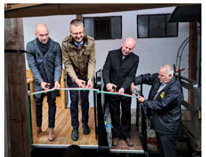
Ünnepélyesen avatták fel a kerékpárszállító kocsit