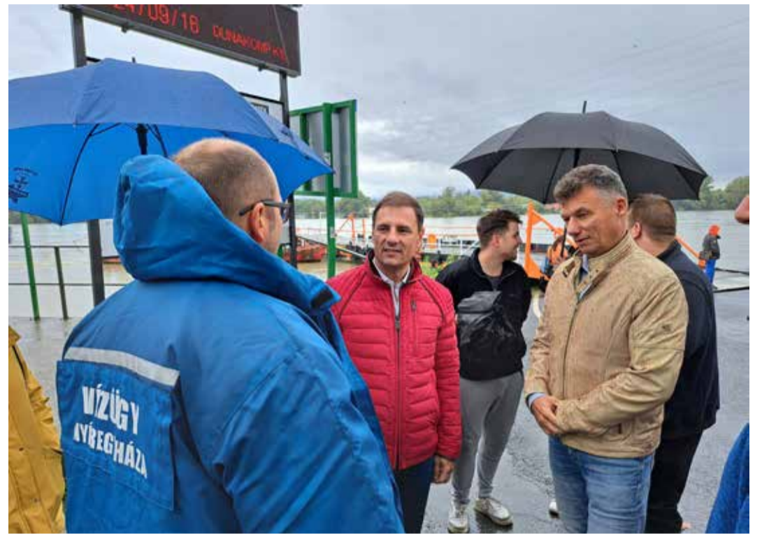
Árvízi védekezés Dunakeszin: egyeztetés a vízügyi szakemberrel és a város polgármesterével

Kérdésünkre válaszolva Tuzson Bence beszélt arról is, hogy a kormány támogatásának, a Máltai Szeretetszolgálat és sok-sok ember munkájának köszönhetően tulajdonképpen egy korszakot zártunk most le azzal, hogy az egykori gödi Topház nehéz múltjának véget vetettünk, és egy új, fényes, emberi jövő vette kezdetét. Két otthonnal és minőségi szolgáltatásokkal bővült ugyanis a napokban a Magyar Máltai Szeretetszolgálat gödi Gondviselés Háza, amivel javulnak a lakók életkörülményei. Erről az igazságügyi miniszter beszélt a két új otthon átadási és felszentelési ünnepségén. Tuzson Bence felidézte hogy egy 2017-ben megszűlelt kormánydöntésnek köszönhető 5,8 milliárd forintos keretből egymás után újulnak meg kisebb-nagyobb épületek a szociális intézményben. Az elmúlt hat évben a korábbi lakók közül már nyolcvanötszáz új helyre, otthonba költöztek. Az új gödi épület együttesben pedig mostan-