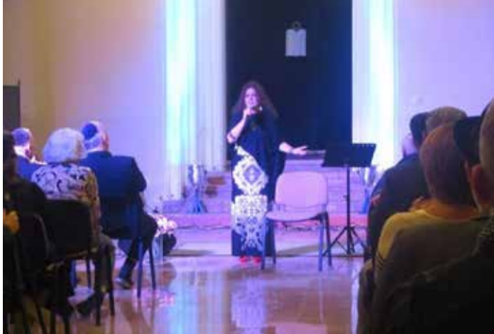
Színvonalas műsorral ünnepelték a jeles évfordulót