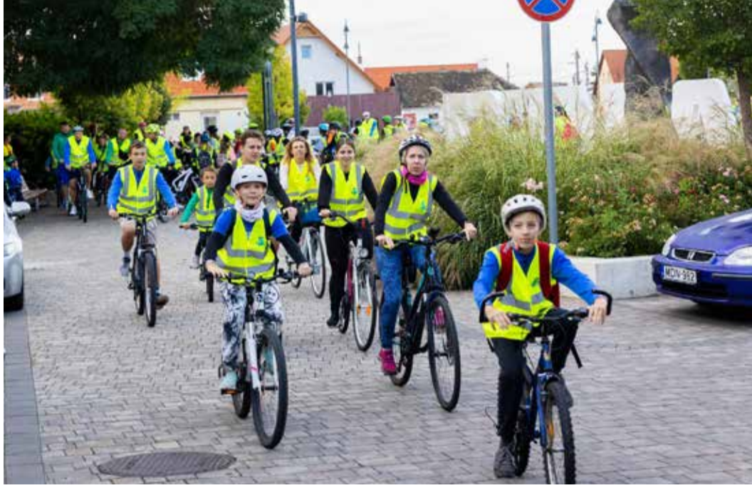
A fiatalok örömmel csatlakoztak a népszerű akcióhoz

Több mint 300 bringás tekert keresztül Dunakeszin, a mobilitási hét zárásaként rendezett biciklis felvonuláson. Gyermek és szülei, diákok és tanáraik csatlakoztak a mozgalomhoz, amelynek célja, hogy segítse az autómentes közlekedés ösztönzését.