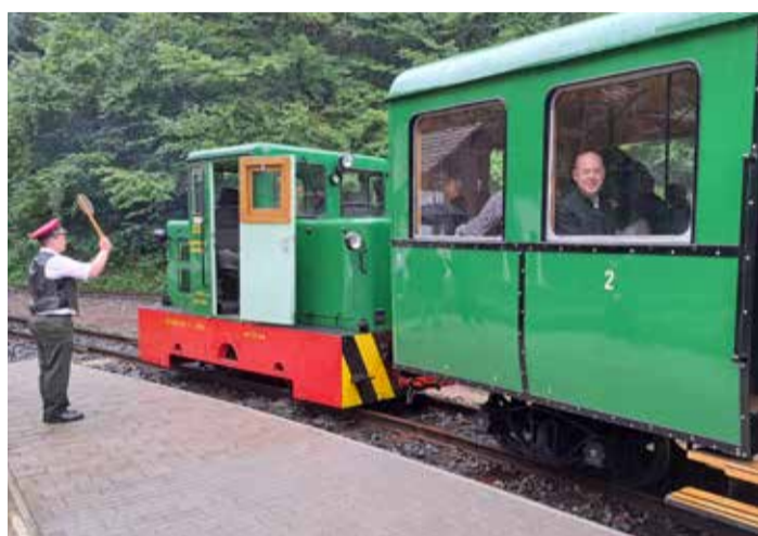
A kirándulók körében rendkívül népszerű a börzsönyi kisvasút

A három börzsönyi kisvasúton, a szobin, a kemencein és a nagybörzsönyin évente 150 ezer utas is megfordul – mondta Rétvári Bence, a a Belügyminisztérium (BM) parlamenti államtitkára szeptember 14-én a 116 éves Nagybörzsönyi Erdei Vasút ünnepnapján, amelyen egy kerékpárszállításra alkalmas vasúti kocsi is átadtak.