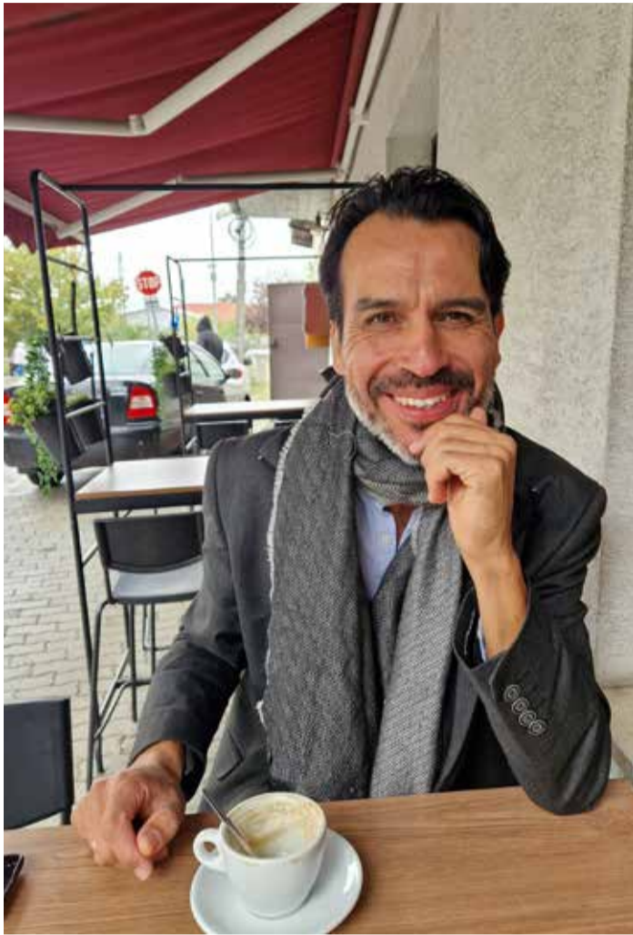
Dunakeszi az otthonom, szeretnek az emberek engem és a kultúrámat

Egy mexikói művész, aki Dunakeszin lelt otthonra