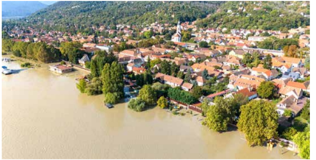
A hatalmas víztől Nagymarost a fenti képen látható mobilgát védte meg

Ehhez képest itt Magyarországon, bár ugyanaz az esőzés volt, és ugyanaz az árhullám vonult le, de mégis Magyarországon sokkal kevesebb ilyen rendkívüli intézkedést kellett tenni, jobban és erősebben álltak a védművek az árvízet.