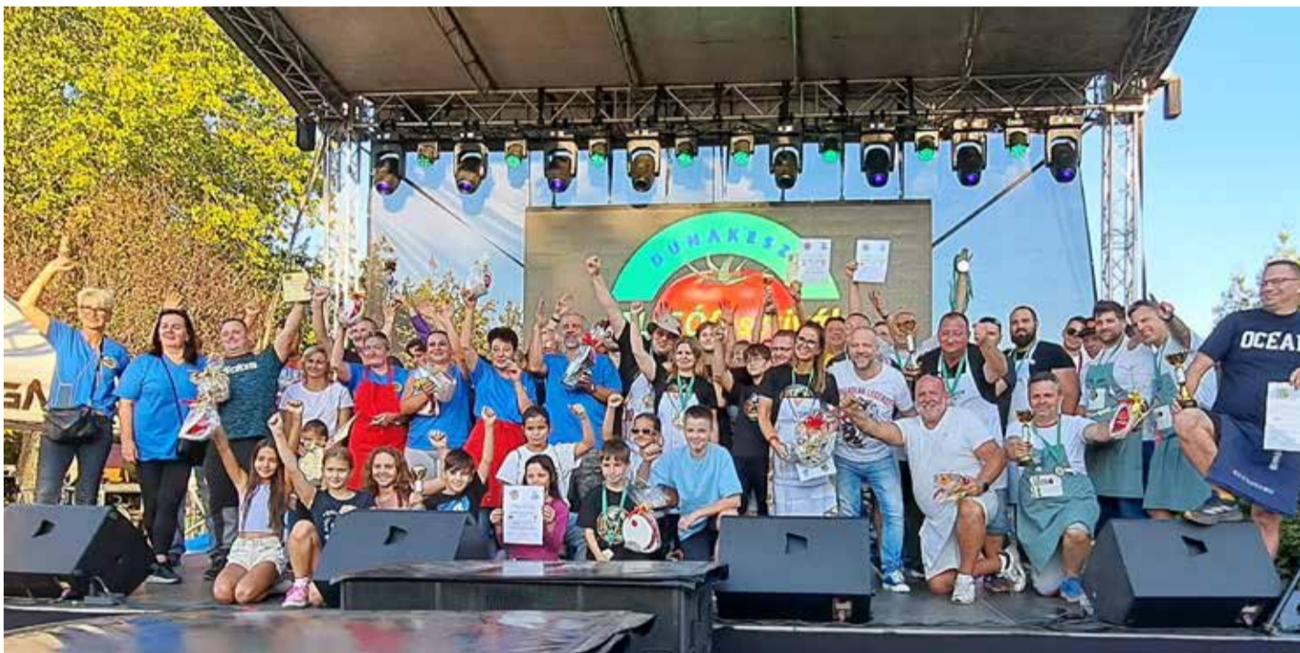
A fesztivál szervezői és a versenyen induló csapatok tagjai az ünnepélyes eredményhirdetés után

A gyönyörű szép őszi vasárnapon több százan látogattak el a város egyik legkedveltebb gasztronómiai és kulturális rendezvényére a Dunakeszi AlcsÓfesztiválra, melyen huszonekét csapat főzte az egyedi ízesítésű lecsót, miközben énekeltek, sőt, voltak, akik táncra is perdültek.