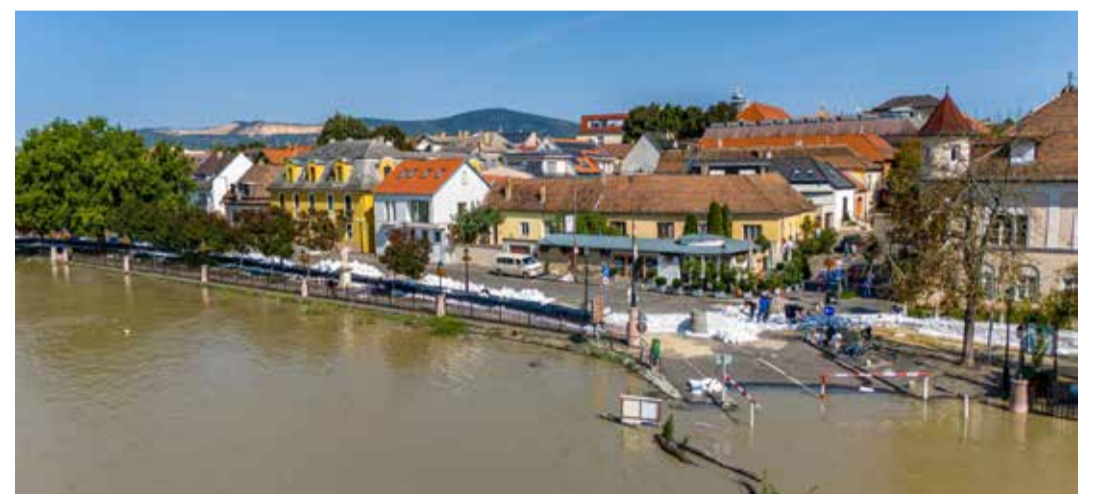
Vácon is több százan védték a várost

- Biztos lesz pár olyan következtetés, amit a vízügyesek levonnak, és a jövőbeni eredményes védekezés érdekében megfontolásra javasolnak. Hamarosan lesz egy háromnapos kormányülés, melyen az árvízi védekezésben résztvevő állami szervek képviselői ismertetik a szakmai tapasztalatokat és javaslatokat, azokat a fejlesztéseket, melyek megvalósítása a jövőben segítheti az árvízi védekezést. Mert – mint ahogy 2013-ban és a napjainkban volt úgy – valószínűleg a jövőben is lesz dunai árhullám, amivel szemben védekezniük kell. Oda kell figyelniük, hogy a jó-