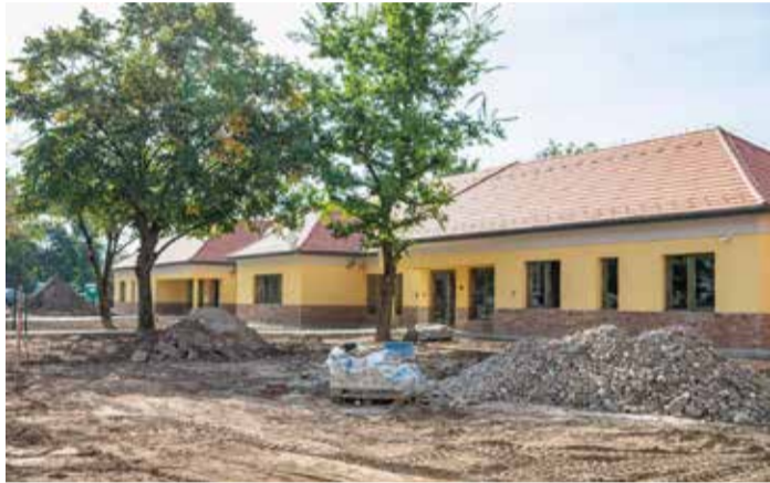
Két új otthonnal és minőségi szolgáltatásokkal bővült a napokban a Máltai Szeretetszolgálat gödi Gondviselés Háza

A védekezésnek még nincs vége, továbbra is figyelemmel kell kísérni a védművek és a védvonalak állapotát – fogalmazott a lapunknak adott nyilatkozatában Tuzson Bence, térségünk országgyűlési képviselője, hazánk igazságügyi minisztere, aki szerint lassú apadásra számíthatunk, ezért folyamatosan figyelni kell. Mint mondta, a vízügyi szakemberek az ország minden pontjáról segítettek és még mindig segítik a védekezést, Dunakeszire például egészen Nyíregyházáról érkeztek. Köszönjük a munkájukat – tette hozzá a képviselő.