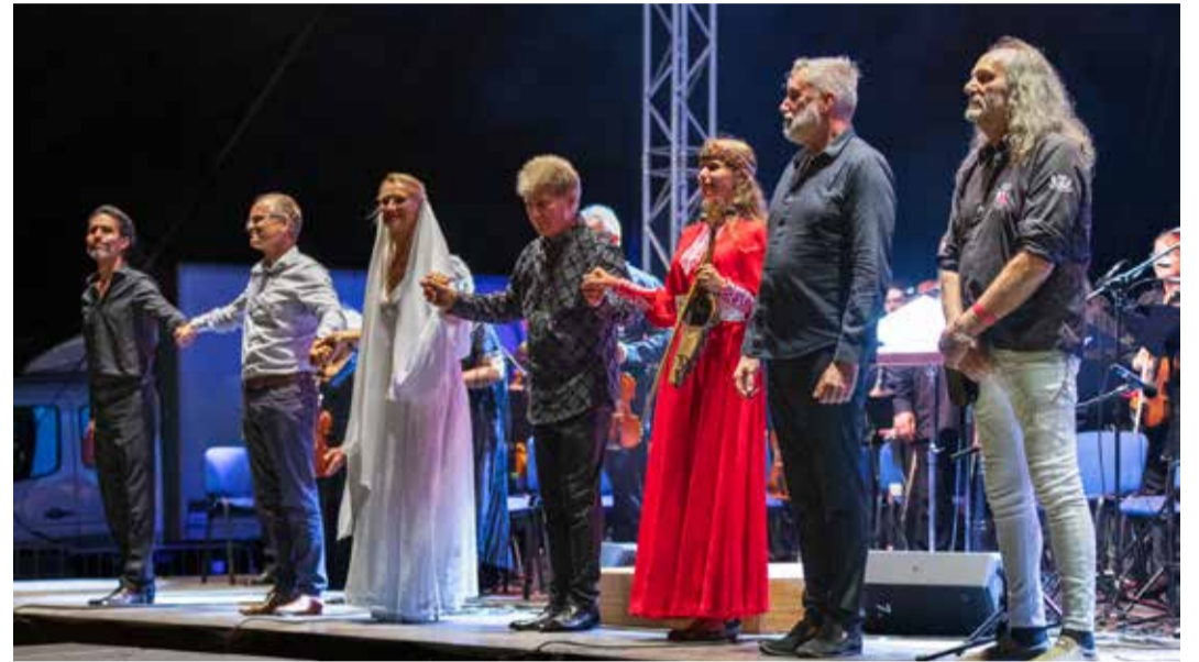
A nagy sikerű zenés előadás szerzői és szereplői

zéséhez. A közeli Fóton pedig a termelői piac fejlesztésére kapott vissza nem térítendő támogatást a város önkormányzata.