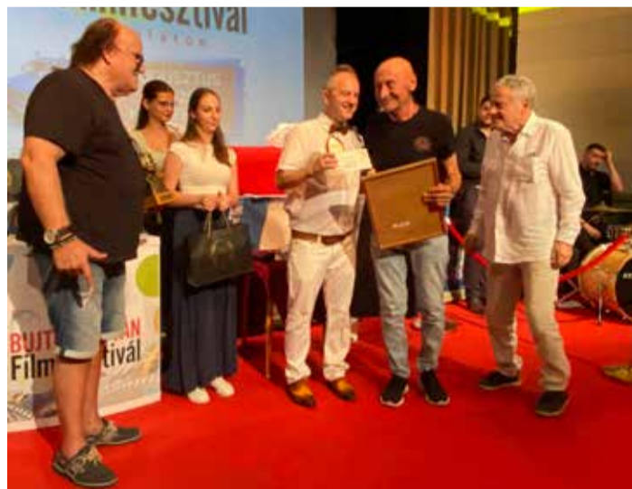
Reviczky Gábor, a Nemzet Művésze, Kossuth- és Jászai Mari-díjas színművész életmű díjat vehetett át

Bujtor István-díjat érdemelt ki a My Back Story és A döntés című dokumentumfilm, a Vasárnapi emberrablás című kisljátékfilm, valamint a Hat hét című nagy-