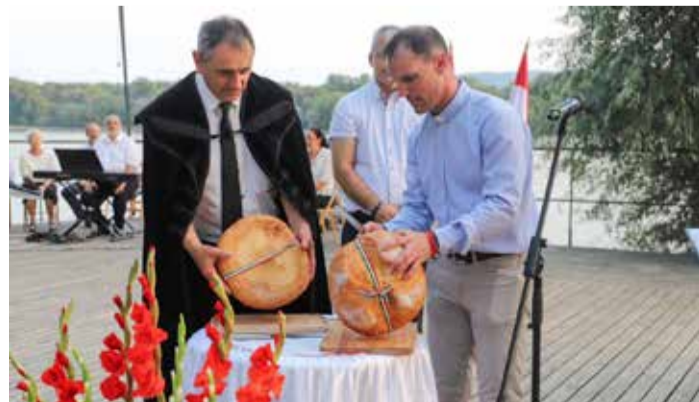
Egyházi méltóságok szegték meg az általuk megszentelt új kenyeret