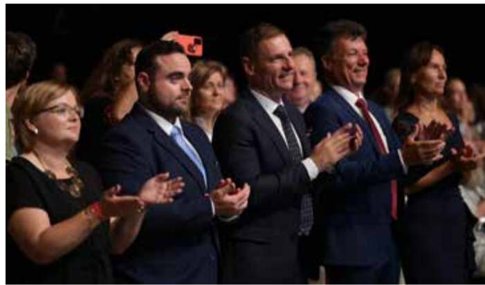
Dunakeszi országgyűlési képviselőjének és a város vezetőinek is tetszett az ősbemutató

ben végighallgatni az oratórium ősbemutatóját. Augusztus 20-án ugyanis Dunakeszin megtartottuk a Szent Korona országa című oratórium ősbemutatóját, amelyben mintegy kétszázötven előadó vett részt, a közönség pedig élvezhette hazánk történetének megzenésített előadását. Jó volt látni, hogy ennyien összegyűlünk és közösen ünnepelhetjük Magyarország születésnapját. A szervezőknek, a szerzőknek és az előadóknak ezúton is gratulálok a páratlan előadáshoz! Külön öröm számomra, hogy a Dunakeszi Szimfonikus Zenekar Egyesülete jelentős támogatásban részesült az ősbemutató megrende-