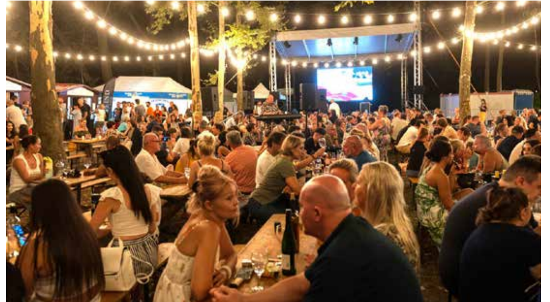
A kétnapos rendezvény több ezer látogatót vonzott

Finom borok, remek programok, jó hangulatú baráti beszélgetések és a kiváló borászok szakmai információi tették teljessé a Duna-parti rendezvényt, melyre az első napi nagy siker után szombaton is különleges élményekkel várták a II. Dunakeszi Borsétányra kilátogatókat.