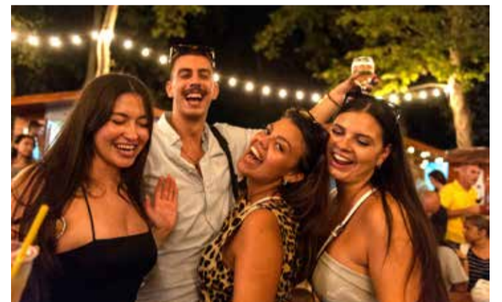
Finom borok - remek hangulat