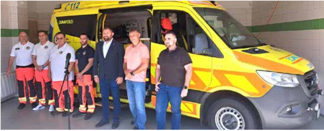
Minőségi előrelépés az új esetkocsi érkezése a Dunakeszi Mentőállomásra