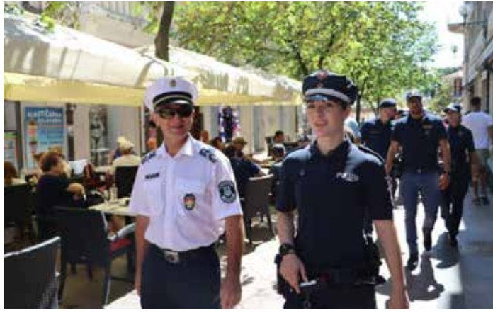
Közösen járőröznek a magyar és a horvát rendőrök

„Önálló intézkedési jogosultságuk nincs, járőrtársi feladatkörben dolgoznak párban a horvát rendőrökkel. A szolgálatl-