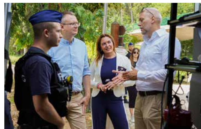
Négy vármegye rendőrei vesznek részt az összehangolt nyári akcióban

Tájékoztatója szerint a rendőrség munkáját a Vízügyi Országos Szakszolgálat, a katasztrófavédelem, a meteorológiai szolgálat, polgárőr-egyesületek, számos horgászszövetség, valamint az önkormányzatok is segítik. FORRÁS: MTI