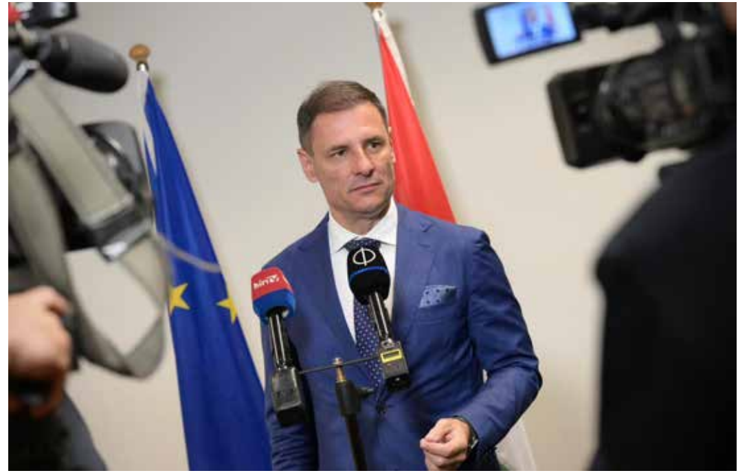
Tuzson Bence országgyűlési képviselő, igazságügyi miniszter

Amióta a térség országgyűlési képviselője lettem, gyakorlatilag nem volt olyan perc, amikor a régió településeinek valamelyikén ne lett volna folyamatban legalább egy fejlesztés, de általában több is párhuzamosan valósul meg egyszerre – folytatta a képviselő, aki hangsúlyozta azt is, hogy folyamatosan zajlanak a munkálatok az egész körzetben, Csömádon, Csömörön, Dunakeszin, Erdőkertesén, Fóton, Gödön és Veresegyházon is. Ezzel párhuzamosan pedig mindig gondolunk a további lépések tervezésére is – tette hozzá. „Meggyőződésem, hogy csak olyan beruházásokat kell megvalósítanunk, amelyek itt helyben találkoznak a lakosság reális igényeivel. Ugyanakkor pedig nagyon fontos az is, hogy a különféle közösségépítő rendezvényeinket meg tudjuk tartani, mert az erős közösségek jelentik a fejlődés zálogát. Éppen ezért is örülök annak, hogy a Dunakeszi Alsó Fejlő-