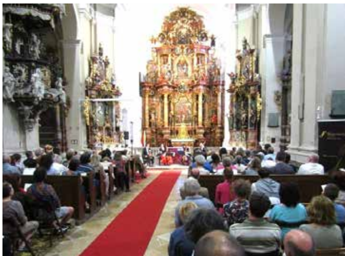
Idén is nagy sikere volt a rendezvénynek

A nyitókoncerten Buxtehude és Bach részben párhuzamos pályájának zeneszerzői hagyatékából adott ízelítőt a hallgatóknak a Vashegyi György vezette Orfeo Zenekar és Purcell Kórus, ráadásul a program zárásakor kívülről is részben átlénygült a Fehérek temploma, miután látványos fényfestésnek köszönhetően egy egészen új arcát mutatta meg a gyönyörű barokk épület.