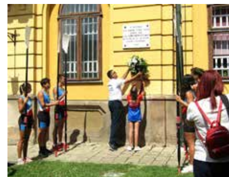
Megkoszorúzták Széchenyi István emléktábláját

Mint a párbeszéd bemutatóban elhangzott, az új kötet elődjének („A váci evezés évszázada”) születésekor az előkészítő munkában a könyvtári, levéltári kutatás dominált, most viszont rendelkezésre állt a VVEC 30 évvel ezelőtti megalakulása óta folyamatosan vezetett évkönyvek adatbázisa, így ezúttal nagyobb hangsúlyt kaphattak a főszereplő nagy bajnokok, klub-