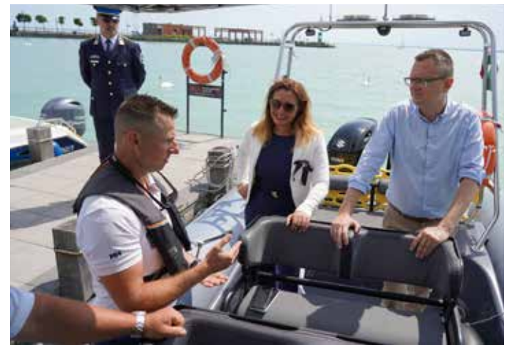
Vitályos Eszter kormánybiztos és Rétvári Bence belügyminiszter-helyettes sajtótájékoztatót tartott a balatoni nyaralók közbiztonságát szolgáló rendőri akciók

Rétvári Bence hangsúlyozta: a Kormányzat kiemelten fontos, hogy minden turista biztonságban érezze magát a Balatonnál és minden más kiemelt turisztikai területen. Ezért a Balatonnál nyáron nagyobb a rendőri jelenlét a bűncselekmények megelőzése, a közlekedés biztonságának fenntartása és az emberek védelme érdekében – tette hozzá.