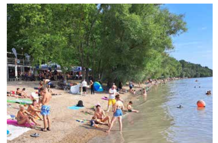
A dunakeszi szabadstrand