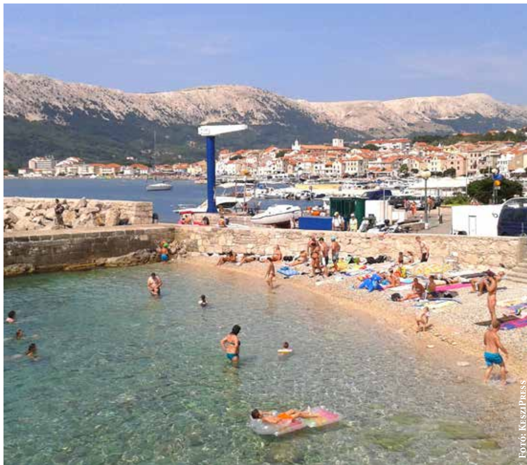
Sokan keresik fel Krk sziget déli csücskében a közkedvelt baskai tengerpartot

Magyar rendőri kontingens utazott Horvátországba annak érdekében, hogy a magyar turisták által leglátogatottabb helyszíneken is vigyázzanak a magyar emberek biztonságára – tájékoztatót Rétvári Bence, a Belügyminisztérium parlamenti államtitkára.