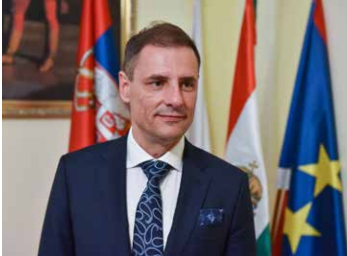
Tuzson Bence igazságügyi miniszter, a térség országgyűlési képviselője

Térségünk több településén is nagyszerű eredményeket értünk el az elmúlt néhány hónapban, amit bárki személyesen is megtapasztalhat – mondta el a lapunknak adott nyilatkozatában Tuzson Bence, térségünk országgyűlési képviselője, hazánk igazságügyi minisztere, aki példaként említette Gödöt, ahol a város hangulatára és a fejlesztések ütemére utalva felhívta a figyelmet a járda- és útépítésekre, a térfelügyelő kamerák telepítésére, hiszen folyamatosan zajlanak a munkálatok, mindig készül, mindig zöldül valami. Mint mondta, húsz évvel ezelőtt nyerte el a városi rangot a térségünkhöz tartozó Fót, ami ugyancsak egy olyan jeles jubileum, amelyik különleges megvilágításba helyezi a helyi fejlesztéseket.