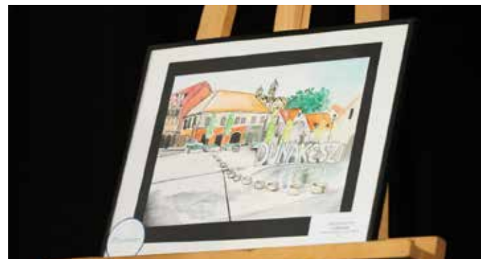
Egy alkotás a sok közül