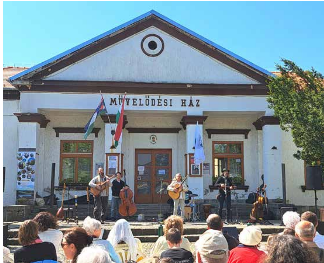
A Kossuth-díjas Misztrál együttes műsorával vette kezdetét a születésnap ünnepség

„21 emberöltő telt el Nagymaros városává nyilvánítása óta. 21 nemzedék váltotta egymást, anyák, lányok, apák, fiak, nagyszülők, unokák hosszú sora a közösségben biztosította városunk fennmaradását és fejlődését. Mekkora elismerést, lehetőséget jelentett, hogy Károly Róbert 1324-ben Maroslakóit Buda város kiváltságai ruházta fel, Visegrád ikervárosává nevezett ki. A településünk nem sokkal később kapta meg a városi rangokat, mint például Kolozsvár és Pozsony. Az, hogy a világtörténelemben is el tudjuk helyezni ezt a számunkra különleges évet, míg a marosi halászkok 1324-ben vizákat fogtak a Dunában, ebben az évben halt meg Marco Polo, a velencei nagy világgutató, aki