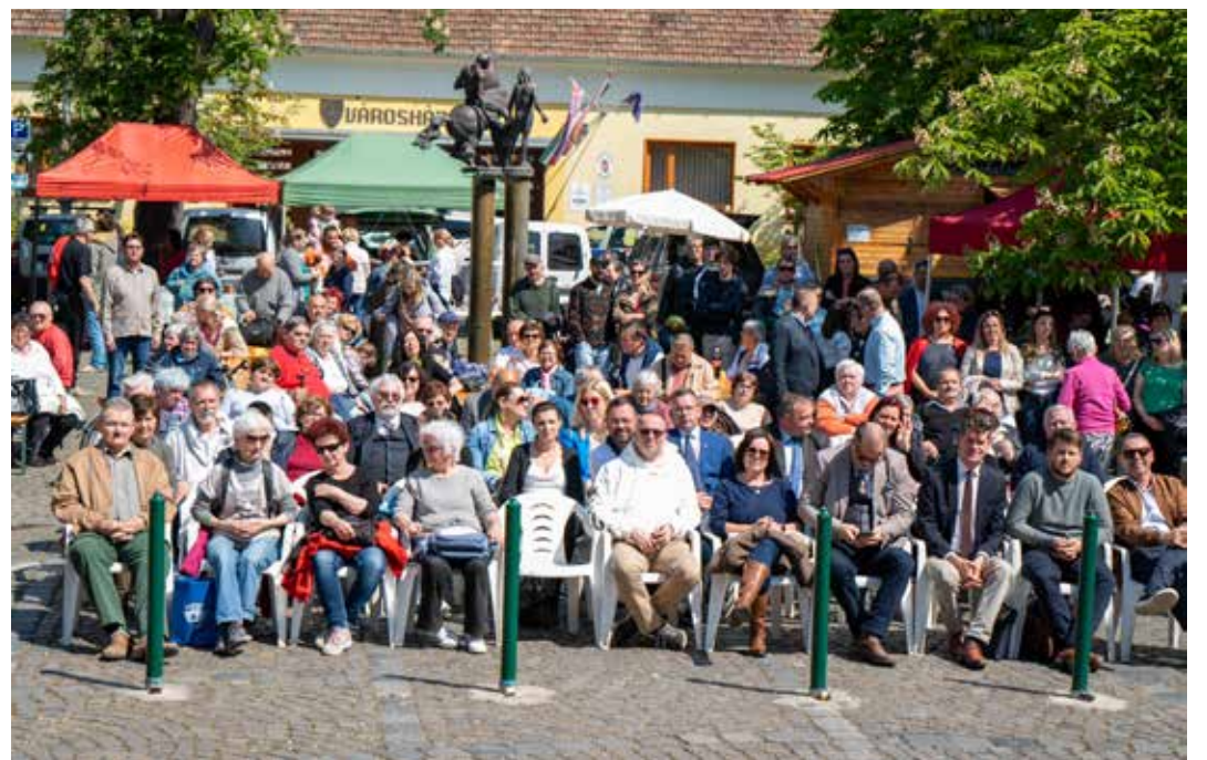
Az ünneplő nagymarosiak

FISCHER-VETÉSI FOTÓ: SZABÓ CSABA ÉS KESZIPRESS