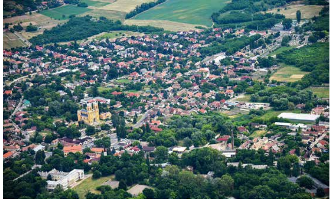
Fót látképe. 20 éve kapott városi rangot a település

zson Bence beszélt arról is, hogy az ötezer fő feletti településeken CSOK Plusz néven új, kamattámogatott hitelkonstrukciót vezettek be: „Ugyan-