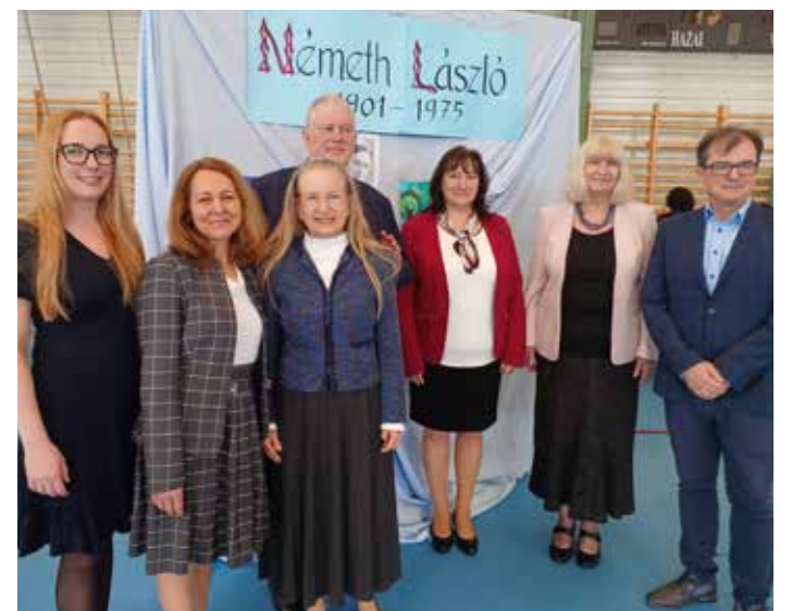
Az iskola közössége Idén is tartalmas programmal emlékezett meg a jeles névadójukról