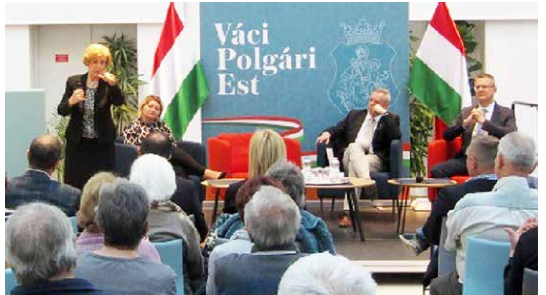
Hatalmas érdeklődés övezte dr. Bagdy Emőke szakmai előadását

„Nekünk azzal, hogy férfiak és nők vagyunk, küldetésünk van, az a küldetés, hogy két ellentétes nemű ember egy pár lesz, egy nagy egész, olyan egész, amely arra hivatott, hogy családot hozzanak létre. Ráadásul úgy, hogy mindketten a legjavát adják annak, amit magukkal hoztak, és így