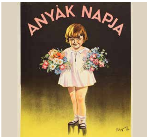
Anyák napi plakát 1932-ből (Pályi Jenő alkotása, OSZK PKG 1932/30)

A LEGELSŐ MAGYARORSZÁGI ANYÁK NAPJÁ ÜNNEPSÉGET 1925. március 8-án, a Magyar Királyi Államvasutak gépgyárának foglalkoztatójában tartották, a munkásgyerekek és anyukáik részvételével. „A gyermek szeret és tud adni is s ezért az ajándékozás lényeges alkotó eleme az ünnepnek, mert fordított viszonyt teremt az anya és gyermeke közt s az utóbbit új erkölcsi érzéssel ismerteti meg — az adás örömeivel.” — írta az eseményről a Nemzeti Újság.