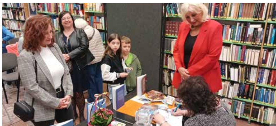
Gyorsan népszerű lett a könyv

magát, nemcsak turistaként, hanem sokan már ott is élnek. Megfigyeltem az angolokat, arabokat, indiánokat, románokat, magyarokat egyaránt. Személyes élményeim, tapasztalataim is megírtam ebben az útinaplóban, melyek között igen sok negatív ’képet’ mutat, de az